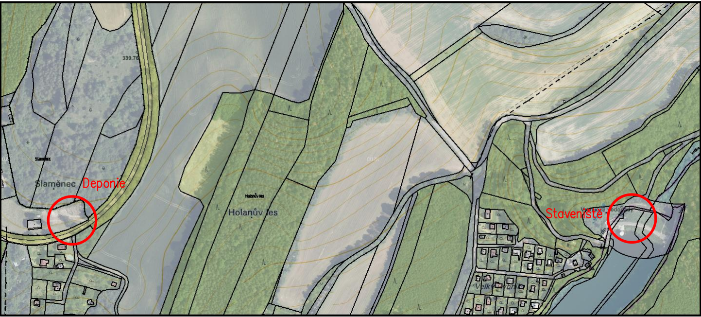
M 1:5000